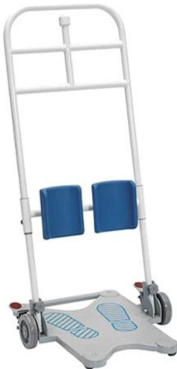
Руководство по покупке вспомогательного средства для перехода с места на место

Сядьте, чтобы встать Вспомогательное приспособление для перемещения из положения сидя в положение помогает при поворотном перемещении между различными поверхностями сидений и может перевозить пользователей на короткие расстояния. Снижает нагрузку на человека, осуществляющего уход, и обеспечивает безопасное и удобное перемещение при повороте для людей, которым требуется дополнительная поддержка при стоянии.